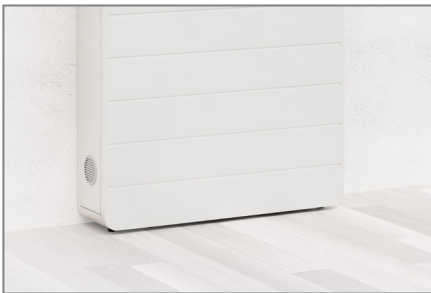
Stellfüße unter dem Korpus sorgen bei Bedarf für einen Niveaueausgleich