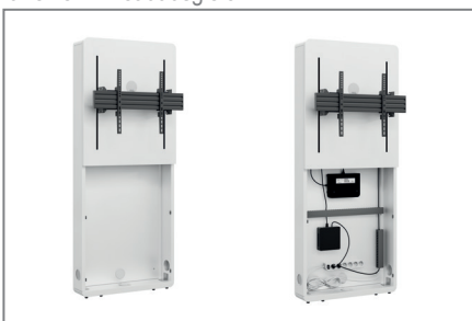
AV-Zubehör findet im Inneren problemlos Platz