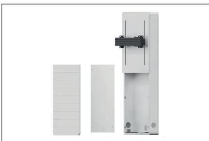
Einfache Montage durch herausnehmbare AV-Montageplatte